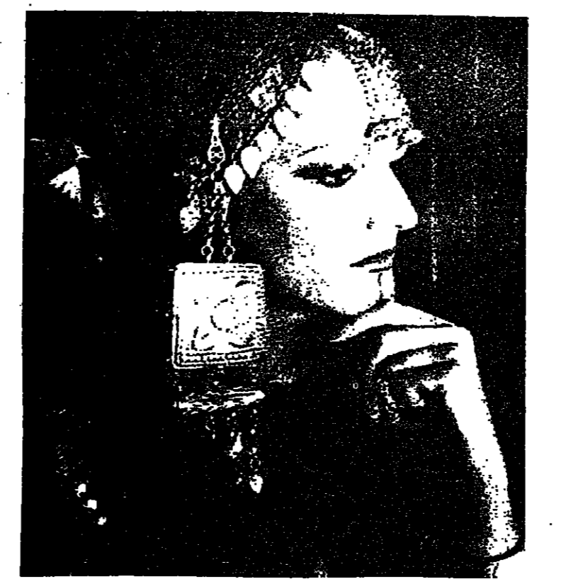
الحلى العربية.. جزء من التراث